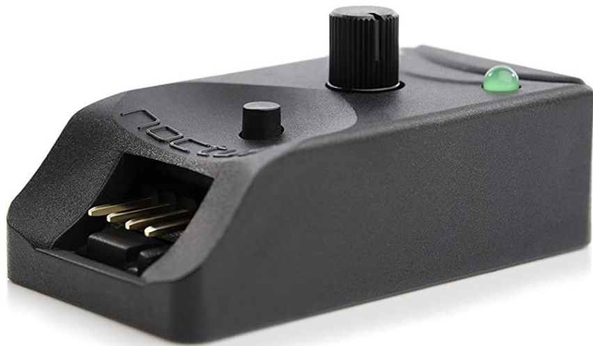
Noctua NA-FC1 , Controlador de Ventilador PWM de 4 Pines (B x H x T) 25 x 21 x 48 mm